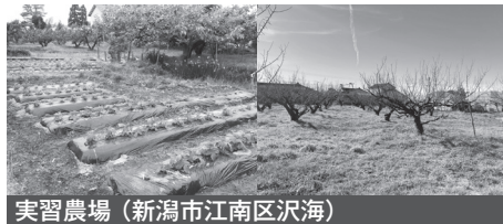
実習農場(新潟市江南区沢海)